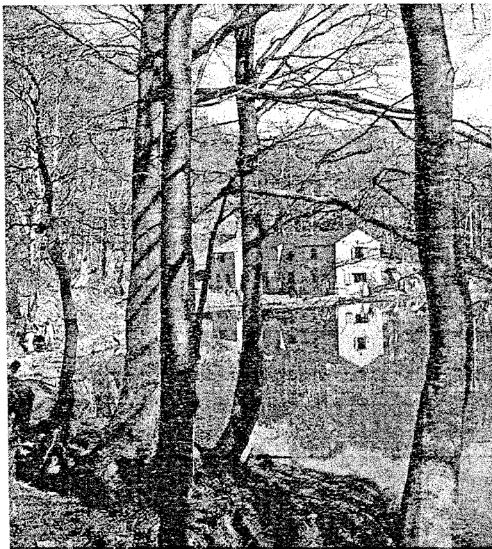
Resistenza Il rifugio Mariotti al Lago Santo, teatro nel marzo '44 di una battaglia durata venti ore.